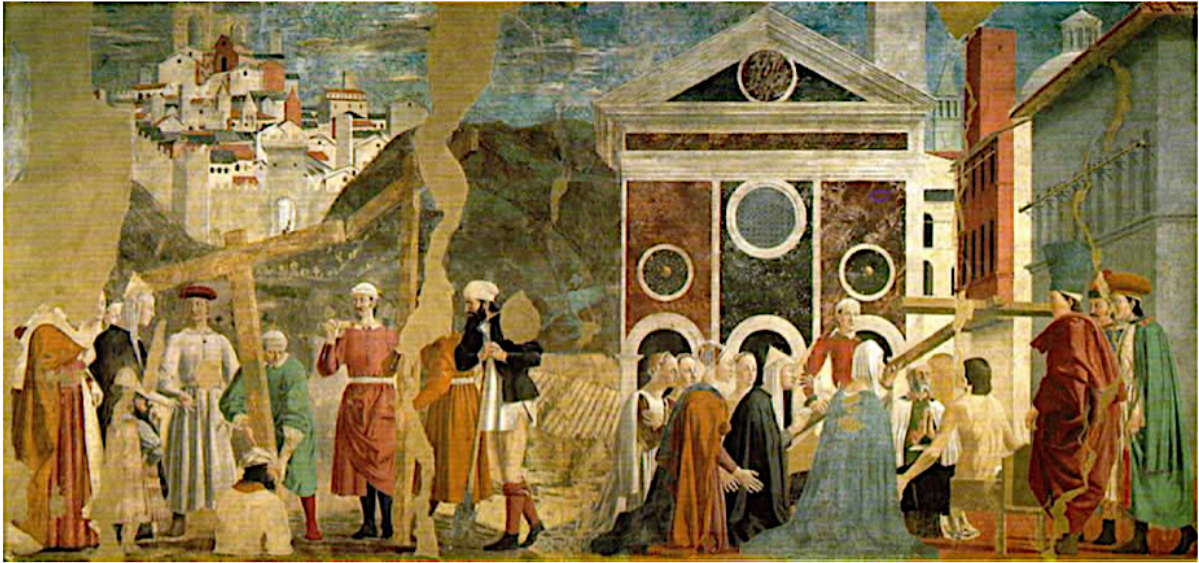
Piero DELLA FRANCESCA, Découverte et vérification de la vraie croix

Fresque (peinture murale) issue de la série « La légende de la vraie croix » réalisée entre 1452 et 1466 dans la basilique San Francesco, à Arezzo (Italie)