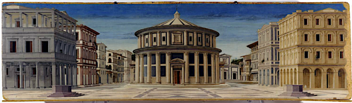
Piero DELLA FRANCESCA (attribué à), La Cité idéale , vers 1475-1480

Huile sur bois (675 x 239,5 cm). Galerie d'Urbino, Italie